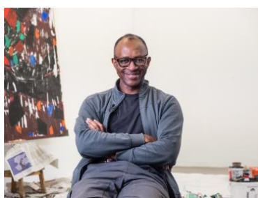
por Emeka Udemba © MISEREOR.