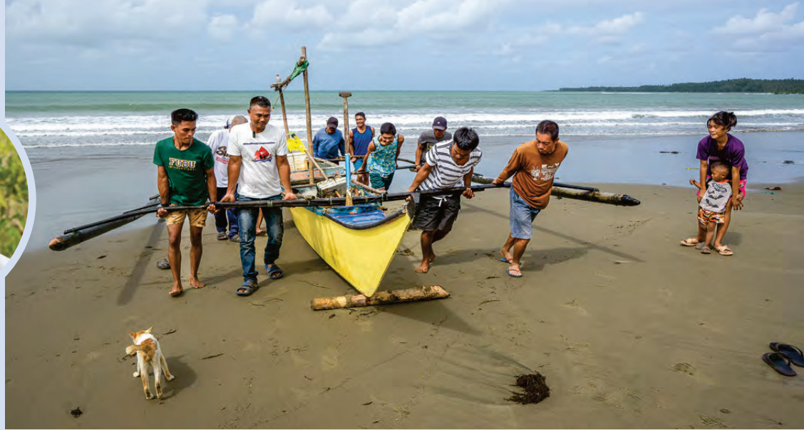
Nach vielen Stunden auf dem Meer kehren die Fischer mit ihrem Fang zurück. Dank erfolgreicher Schutzmassnahmen finden sie heute wieder mehr Fische in Küstennähe.